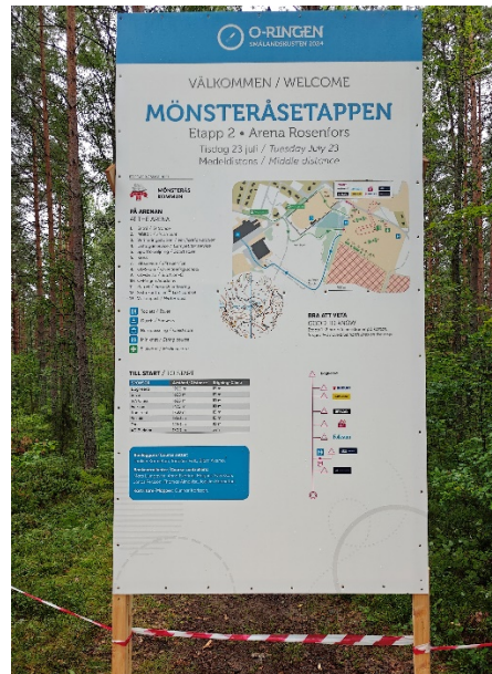
Välkommen till andra etappen.