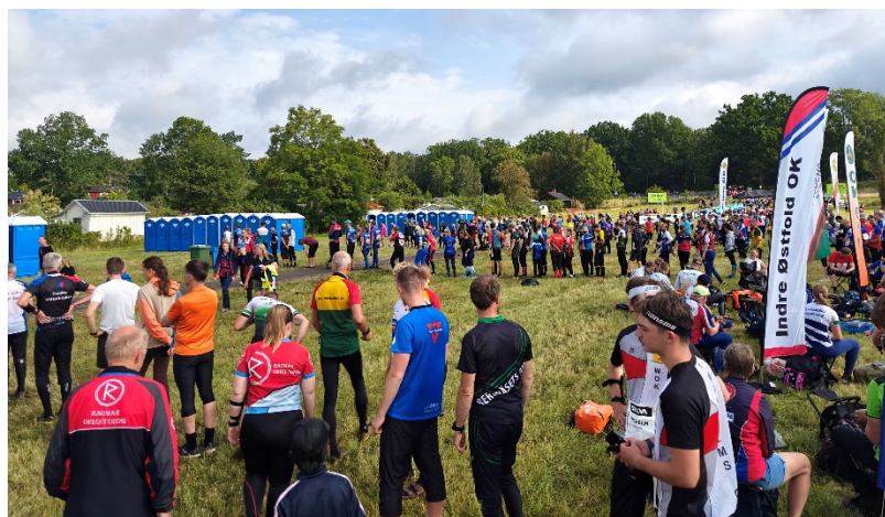
Kö till bajamajorna innan start sista tävlingsdagen.

Om jag ska göra en summering så var det liknande känsla efteråt som 2019 med reklamen inför det årets Öringen då det pratades mycket om Östergötland och Kolmården. Men det blev elljusspår i Finspång och livsfarlig utförlöpning i Yxbackens steniga slalombana. Inte i närheten av Kolmårdens djurpark med lejon